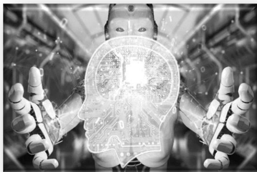
Ilustración 9. IA: Nueva Forma de Pensamiento y Evolución.

La preocupación mundial sobre la gran posibilidad que existe sobre la sustitución del ser humano es, aunque no sea quiera, un desarrollo que éste debe afrontar por el simple hecho de que las tareas y actividades que desempeñan las personas deben modernizarse, deben facilitarse y deben llegar a cuestionar nuestra existencia, pues sólo así, el ser humano estará en la capacidad y necesidad de desarrollar nuevas tecnologías que mitiguen o limiten las funciones de estas tienen y que vienen perjudicando su rol. Así mismo, es importante resaltar que: